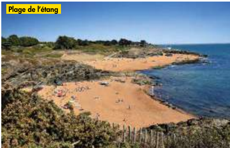
Plage de l'étang