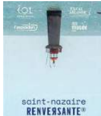
Le Port de Saint Nazaire