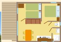
Plan non contractuel

CHALET 1 à 4 places/people/pers. - 2 chambres/bedrooms/slaapkamers