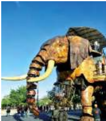
Les Machines de L'île de Nantes