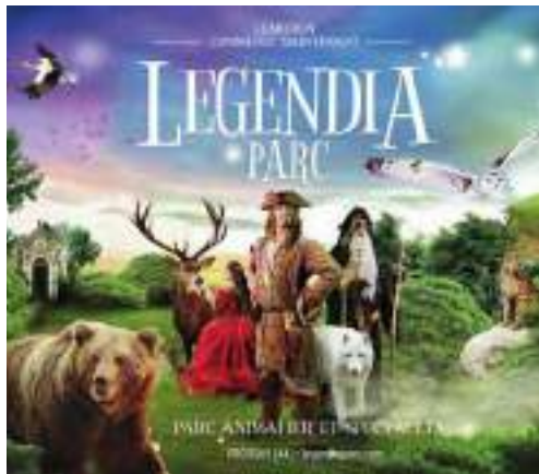
Legendia parc - Frossay