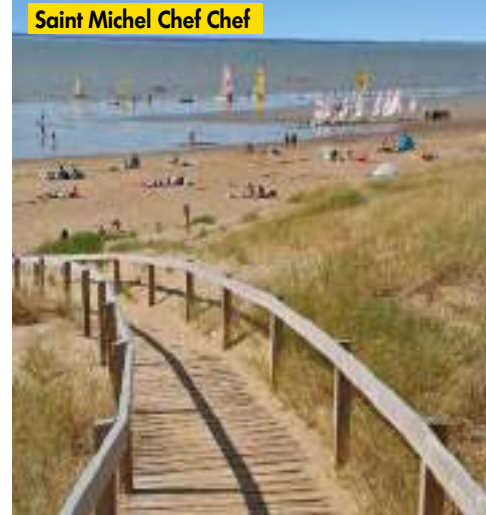
Saint Michel Chef Chef