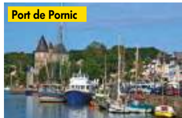
Port de Pornic