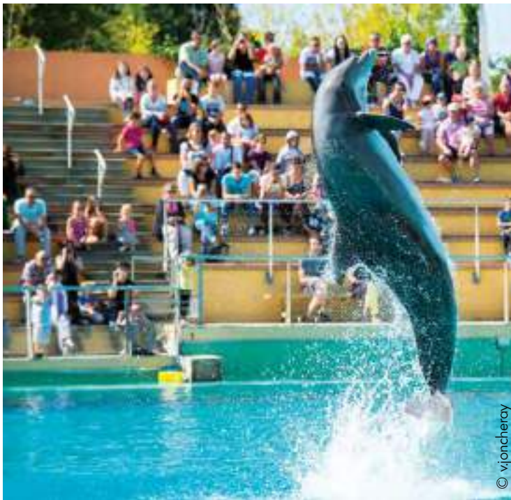
Planète Sauvage à Port St Père