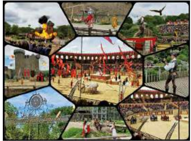
Le Puy du Fou