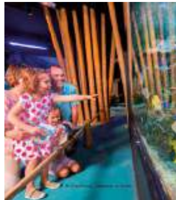
Océarium du Croisic